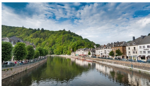
Figuur 5, De Ardennen

Verder blijkt uit het onderzoek dat de kust en de Ardennen respectievelijk perfect zouden zijn, voor meer dan 70% ondervraagden, als binnenlandse bestemmingen. Ook de Vlaamse kunststeden en andere Vlaamse groene regio's vallen in de smaak. Eén op de drie Limburgers overweegt een vakantie in eigen provincie. De criteria om volgens de ondervraagden een reis te overwegen zijn: een kleinschalige accommodatie met een variatie aan ontspanningsmogelijkheden in de omgeving, aan een scherpe prijs met gratis annulatieverzekering als mogelijkheid. (Jacobs, 2020)