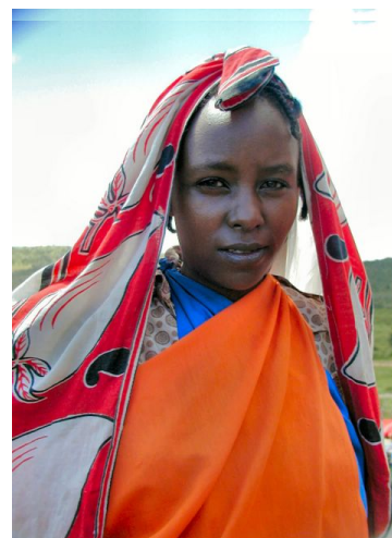
Figuur 3