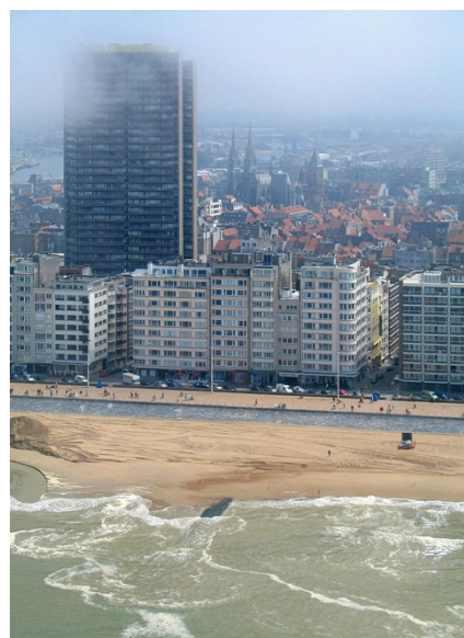
Figuur 7, Oostende