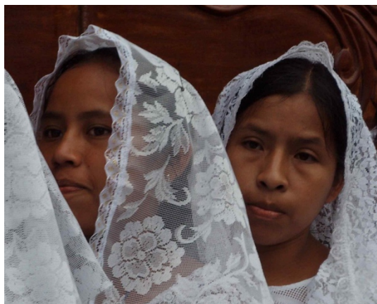
Figuur 1

De activiteiten tijdens het evenement zijn afhankelijk van wie katholiek is en wie niet. De gelovigen gaan in deze week deelnemen aan allerlei religieuze vieringen terwijl de ongelovigen de focus leggen op vrije tijd met de familie. De Costa Ricanen, of ook de Tico's genoemd, trekken massaal naar de kust om een korte vakantie te nemen. De inwoners die oorspronkelijk aan de kust wonen, trekken eerder weg om de drukte te vermijden. (TCRN staff, 2019)