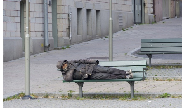
Figuur 2

In meerdere Europese landen die ernstig getroffen zijn door het virus, vormt men hotels, kantoorgebouwen en sportscholen om in opvangcentra om er daklozen te isoleren. Het stigma rond daklozen in Rusland is zeer sterk. Dergelijke initiatieven werden er helaas nog niet opgericht. Doordat parken, winkelcentra en treinstations in het hele land dichtgaan en vrijwilligers thuisblijven, zijn er steeds minder mogelijkheden voor daklozen om onderdak te vinden. Hierdoor kunnen ze zich niet isoleren en bestaat er dus een grotere kans om het virus op te lopen. (Burkhead, 2020)