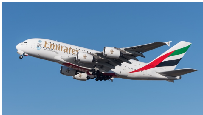
Figuur 9

De eerste bloedtesten werden 15 april afgenomen op de luchthaven van Dubai, de thuishaven van Emirates. Alle passagiers die een vlucht zouden nemen naar Tunesië, werden op voorhand in een speciale zone aan de check-in getest door medewerkers van de gezondheidsautoriteit.