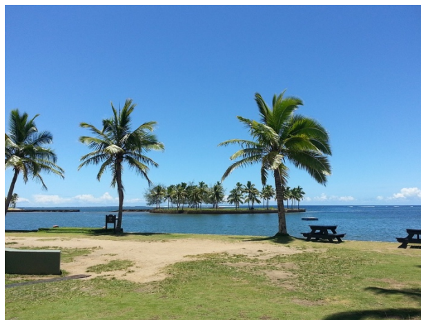
Figuur 4, Fiji

Ook in Fiji lijkt het alsof de wereld stil staat, honderden jobs zijn in gevaar en veel werknemers en werkgevers staan voor een onzekere toekomst. Tot nu toe zijn er slechts 16 bevestigde gevallen in Fiji en gelukkig nog geen doden. Het land reageerde onmiddellijk, toen een eerste besmet persoon bevestigd werd, door de luchthaven te sluiten. Iedereen moet zich verplicht houden aan een avondklok, tussen 8 uur 's avonds en 5 uur 's morgens moet iedereen binnen blijven. De toerismesector is verantwoordelijk voor zo'n 40% van het bruto binnenlands product in Fiji. Er waren hier vorig jaar zelfs meer toeristen afgezakt dan dat er inwoners zijn. De nationale luchtvaartmaatschappij Fiji Airways, heeft zo'n 95% van hun vluchten geschrapt en zeker 279 hotels en resorts zijn gesloten sinds het coronavirus uitbrak. Meer dan 25.000 mensen zijn hun job verloren. Vele mensen in de horeca vroegen al aan de overheid om de taksen te verminderen en hulp te krijgen zodat ze kunnen openblijven. De taksen zijn er zeer hoog, de lonen laag en het leven is er duur, hierdoor hebben vele bedrijven en inwoners weinig kans om te sparen voor noodsituaties als deze. Er wordt verwacht dat de economie van Fiji dit jaar nog in recessie zal gaan, dit na tien opeenvolgende jaren van groei. Toerisme is een business waar nu eenmaal veel menselijk contact bij komt kijken, tegen alle regels van social distancing in, het valt dus nog af te wachten wat er nog verder zal gebeuren.