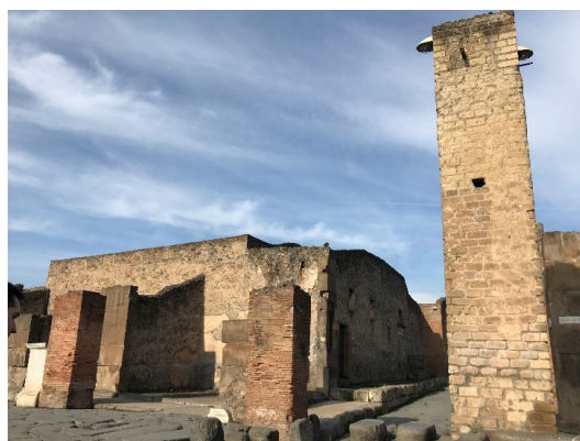
Figuur 11