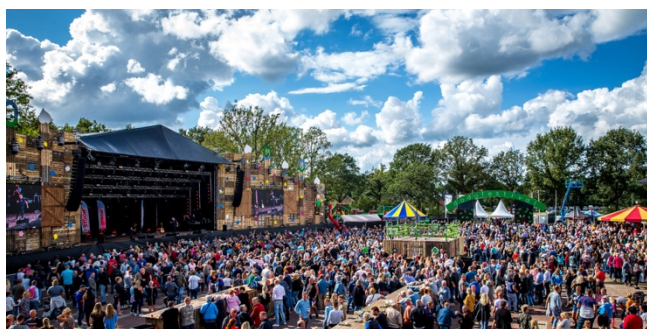
Figuur 12

Het dancefestival Tomorrowland laat weten dat de al 400.000 verkochte tickets zullen worden overgeheveld naar de editie van 2021. Wie niet kan gaan, zal terecht kunnen bij de 'exchange desk' van het festival. Tomorrowland spreekt over een 'enorme impact op ons bedrijf', maar benadrukt dat ook de partners worden getroffen. 'Wij zijn eigenlijk het topje van de ijsberg', zei woordvoester Debby Wilmsen aan VTM Nieuws. 'Een hele eventsector wordt getroffen: leveranciers, bedrijven die podia en geluid regelen, catering en verenigingen, maar ook transportbedrijven en hotels. Het bedrijf is momenteel nog geen financiële puzzel aan het leggen maar wil zich vooral nu concentreren op het informeren van tickethouders en omwonenden. Een uitstel naar het najaar zag Tomorrowland volgens Wilmsen niet zitten. 'We hebben ons laten adviseren door virologen en daaruit bleek dat september ook geen goed idee zou zijn', stelt ze. 'Nog later was dan weer geen optie omdat de kans dan groot is dat het niet zo'n fijn weer is.'