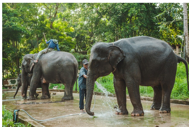
Figuur 6, Thaise olifanten

The Evening Standard publiceerde een artikel waarin ze zeggen dat deze olifanten meer dan 200kg voedsel per olifant, per dag verbruiken! Als de overheid of andere organisaties het niet voor elkaar krijgen om geld in te zamelen om deze dieren te voeden, dan loopt het niet goed af voor hen. Thailand heeft al een lange tijd problemen met het illegaal kappen van wouden, waardoor het nu moeilijk wordt voor de bevolking om zelf voedsel te vinden voor de olifanten. De olifanten loslaten is dus ook geen optie, want er blijven amper wouden over om hen te onderhouden en dan verliezen de eigenaars ook hun belangrijkste bron van inkomen.