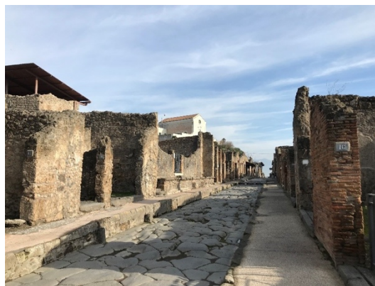
Figuur 10

Via deze link kom je terecht op de website van het archeologisch park. Onderaan de pagina kan je de virtuele tour volgen, deze is enkel in het Italiaans, maar je kan er ook het verhaal lezen in het Engels.